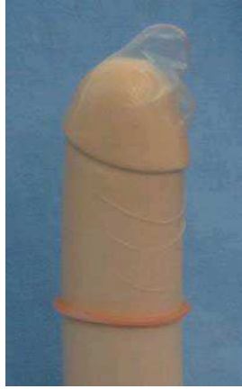
IMAGEN ICÓNICO PLASTICA