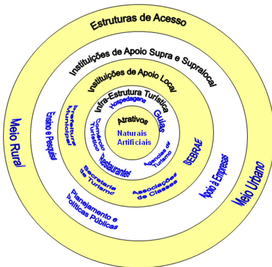
Figura 1: Anillos concéntricos de Modelos Productivos Turísticos